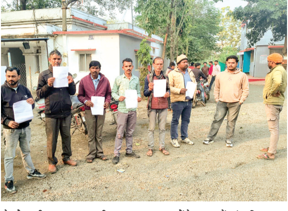
से लोन की आवश्यकता थी। उन्होंने शहर में संचालित एक