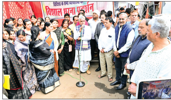
विदिशा। माधवगंज पर धरने को विभिन्न संगठनों के पदाधिकारियों ने संबोधित किया।

रैली में सर्व स्वर्ण समाज के साथ-साथ अन्य समाजों के प्रतिनिधि भी शामिल हुए। प्रदर्शनकारियों का कहना था कि यह कानून न केवल शिक्षा व्यवस्था को