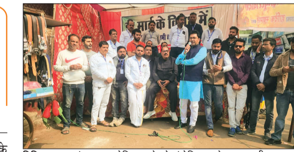
विदिशा। माधवगंज पर आयोजित धरने को संबोधित करते हुए व्यापारी।

इस धरने में शहर के सैकड़ों व्यापारियों, व्यापार महासंघ, मध्यप्रदेश उद्योग व्यापार मंडल, चेंबर ऑफ कॉमर्स सहित अनेक