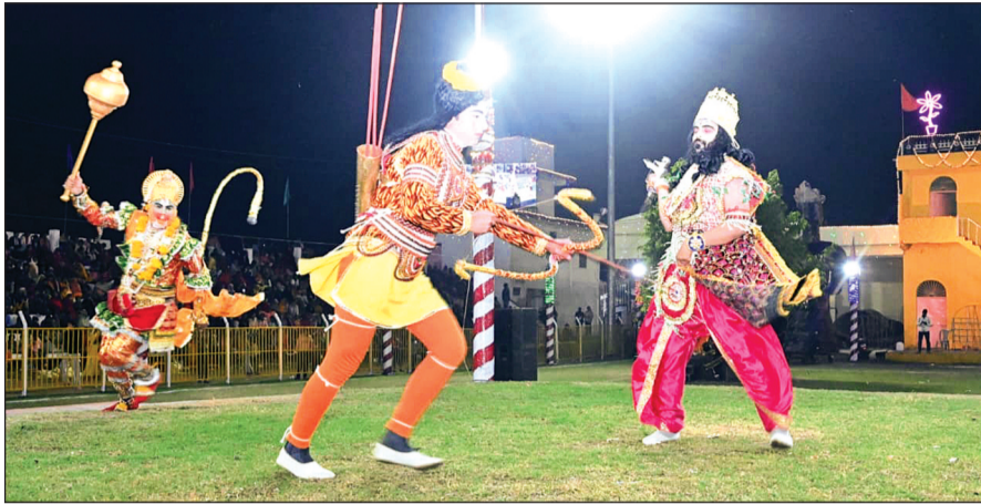
विदिशा। रामलीला में मेघनाथ और लक्ष्मण के बीच हुआ घमासान युद्ध, देखने पहुंचे हजारों की संख्या में दर्शक।

पहचान न केवल प्रदेश बल्कि पूरे देश में है। मंत्री प्रहलाद पटेल ने कहा कि यह रामलीला 125 वर्षों की गौरवशाली परंपरा में प्रवेश कर चुकी है, जो विदिशा के लिए गर्व की बात है। जिस भूमि पर 125 वर्षों से रामकथा का मंचन हो रहा है, वह भूमि स्वतः ही पावन हो गई है। उन्होंने रामलीला को शुरू करने से लेकर आज तक सहयोग करने वाले सभी लोगों की सराहना की। 6 फरवरी को रावण दहन होगा।